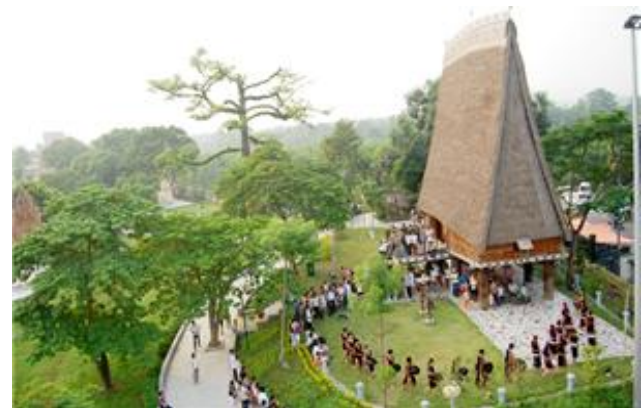
베트남 민족 문화 박물관