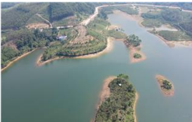
쉐오이랑(Suoi Lanh) 호수