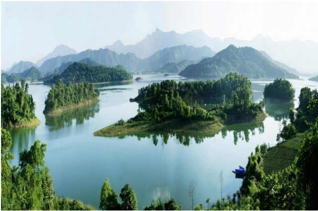
누이콕(Nui Coc) 호수 관광 지역

누이콕(Nui Coc) 호수, 프엉황(Phuong Hoang) 동굴과 같은 많은 자연 경관, 비엣박(Viet Bac) ATK 안전 구역, 쿤마잉(Khuon Manh) 숲 및 버나이(Vo Nhai)현에의 구석기 시대의 고고학 유물과 같은 역사 유적지가 있음. 그 밖에도 성 내 베트남 민족 문화 박물관, 리남데(Ly Nam De) 왕 유적지, 두옴(Duom) 사원, 항(Hang) 절, 푸리엔(Phu Lien) 절, 쉐옹롱(Xuong Rong) 사원, 도이칸(Doi Can) 사원 등 여러 지역에 건축 및 예술 유물, 절 및 사원이 있음. 현재 타이응우옌성은 누이콕(Nui Coc) 호수 관광 지역, 프엉황(Phuong Hoang) 동굴 관광 지역, 머가(Mo Ga) 하천, 쉐오이랑(Suoi Lanh) 호수 및 국제 표준을 충족하는 고품질 호텔 시스템에 투자 계획하고 있음.