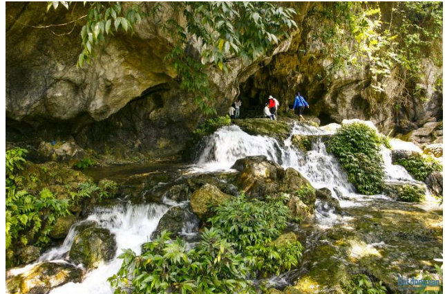
프엉황(Phuong Hoang) 동굴 관광 지역