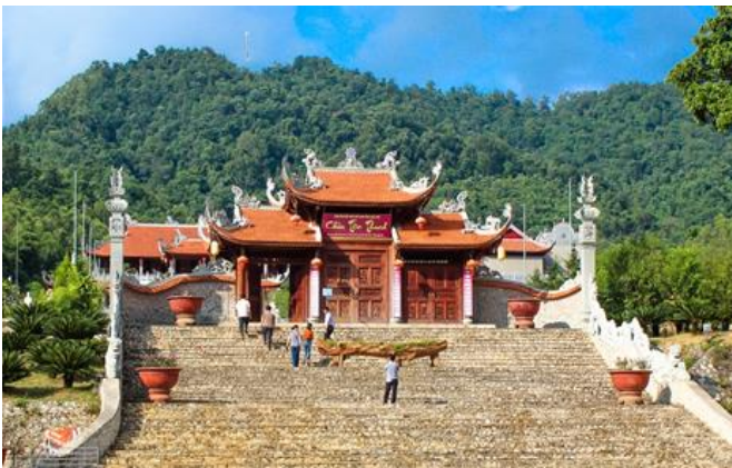
탄타잉(Tan Thanh) 파고다