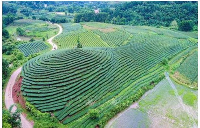
딘랍(Dinh Lap) 녹차