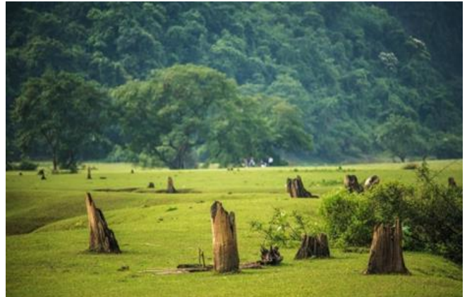
휴리엔(Huu Lien) 공동체 생태관광 지역