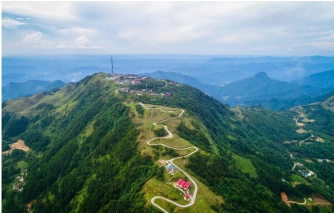
마우선(Mau Son) 산