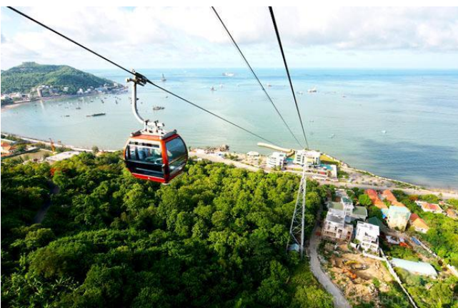
호마이(Ho May) 관광지

바리아-붕따우성에는 붕따우 시, 닷더(Dat Do) 현, 롱디엔(Long Dien) 현 및 쉐옌목(Xuyen Moc) 현의 해변들[호잠(Ho Tram) 해변, 호곡(Ho Coc) 해변 등], 빈자우(Binh Chau) 온천, 호마이(Ho May) 관광지와 같은 아름다운 관광지가 많이 있음. 빈자우-프억부우(Binh Chau-Phuoc Buu) 자연보호 구역에는 원시림, 호수, 깨끗한 해변, 고운 모래, 아름다운 산봉우리가 있으며, 방문객들은 배를 타고 광활한 멜라루카 숲과 습지 생태계를 둘러볼 수 있고 신선한 공기를 즐기며 자연의 아름다움에 흠뻑 빠져들 수 있음. 또한 꼰다오(Con Dao)현에의 꼰다오(Con Dao)는 크고 작은 14개의 섬으로 이루어진 군도로 장엄한 지형, 풍부한 천연자원, 아름다운 풍경과 해변, 유명한 감옥 유적지가 있음.