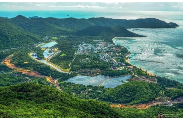
꼰다오(Con Dao) 군도