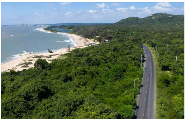
빈자우-프억부우(Binh Chau - Phuoc Buu) 자연보호구역