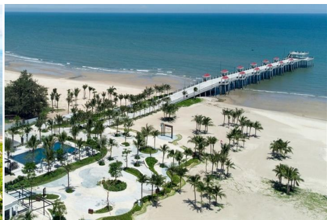
호잠(Ho Tram) 해변